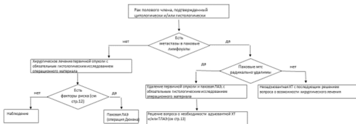
Блок-схема лечения пациента с верифицированным раком полового члена